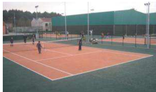
Parque da Cidade – 3 campos descobertos

Colégio N a Sra do Rosário, Escola Tangerina, Colégio N a Sra de Lurdes, Externato Bom Jesus, Colégio Efanor, Escola Francesa, Infantário Chupetão, Santíssimo Sacramento, Externato Cantinho Escolar, Colégio Horizonte, Escola Santa Maria 1 os Passos e O Ramalhete.