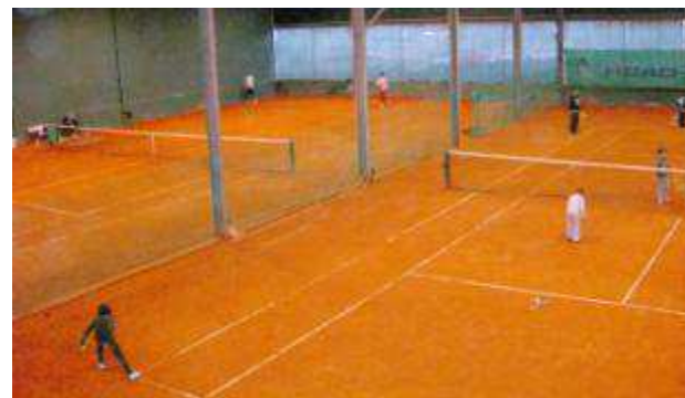
Parque da Cidade – 3 campos cobertos