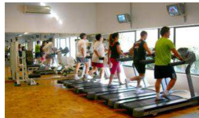
Sala de Musculação