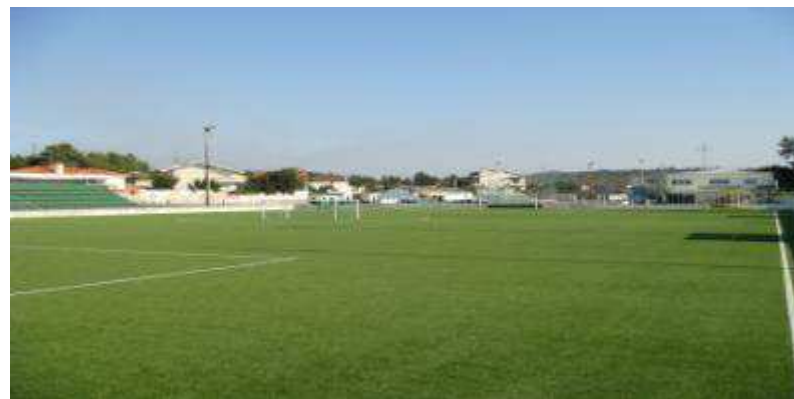
Atlético Clube Bougadense